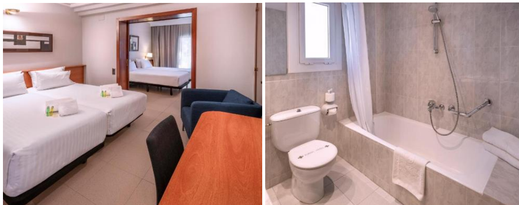
Ciudad de Castelldefels***